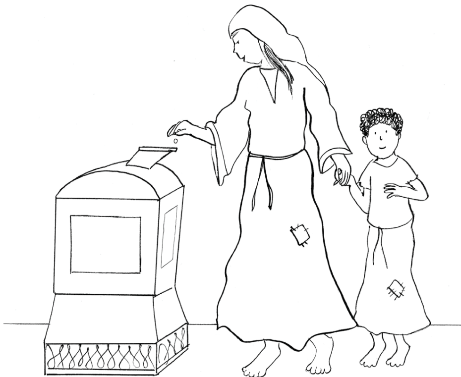
De gift van de weduwe.